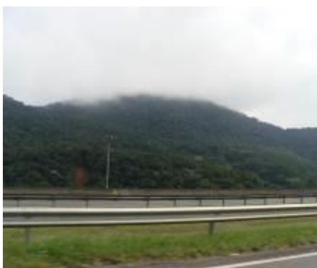
Foto 2.2.1-1 - Floresta Ombrófila Densa em estágio médio de regeneração em formação de continuum florestal em Nazaré Paulista. Coordenadas: 23K, 370011 E - 7436890 S.